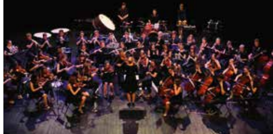
Der Bachkreis auf Le Reunion